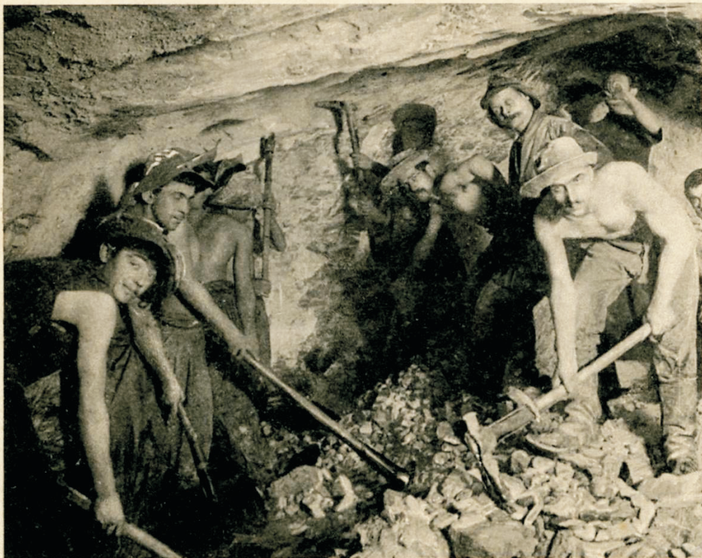
Ultimo sgombro. 24 Febbraio 1905