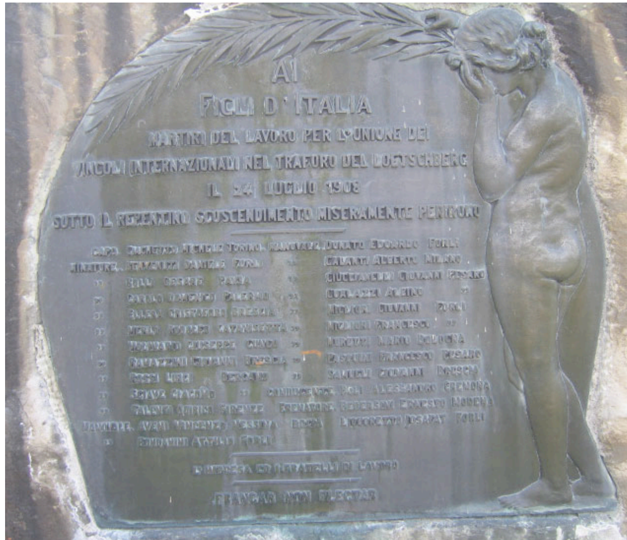
Ai figli d'Italia- Martiri del lavoro per l'unione dei vincoli internazionali nel traforo del Loetschberg il 24 luglio 1908 sotto repentino scoscendimento miseramente perirono