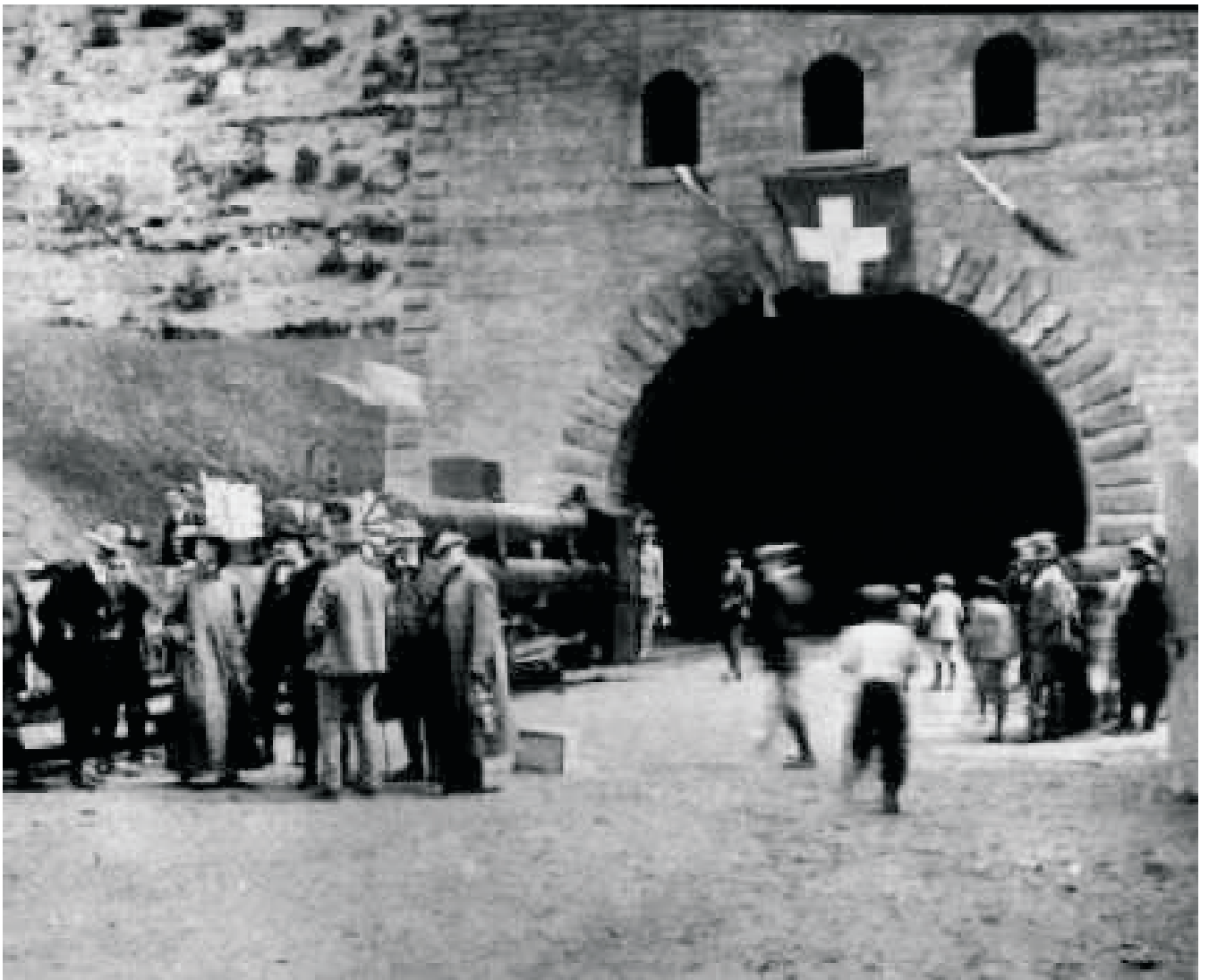
Traforo del Loetschberg, 1906-1913