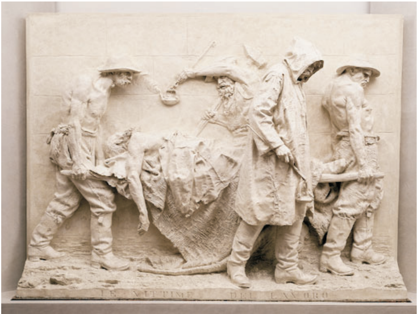
Vincenzo Vela, Le vittime del lavoro