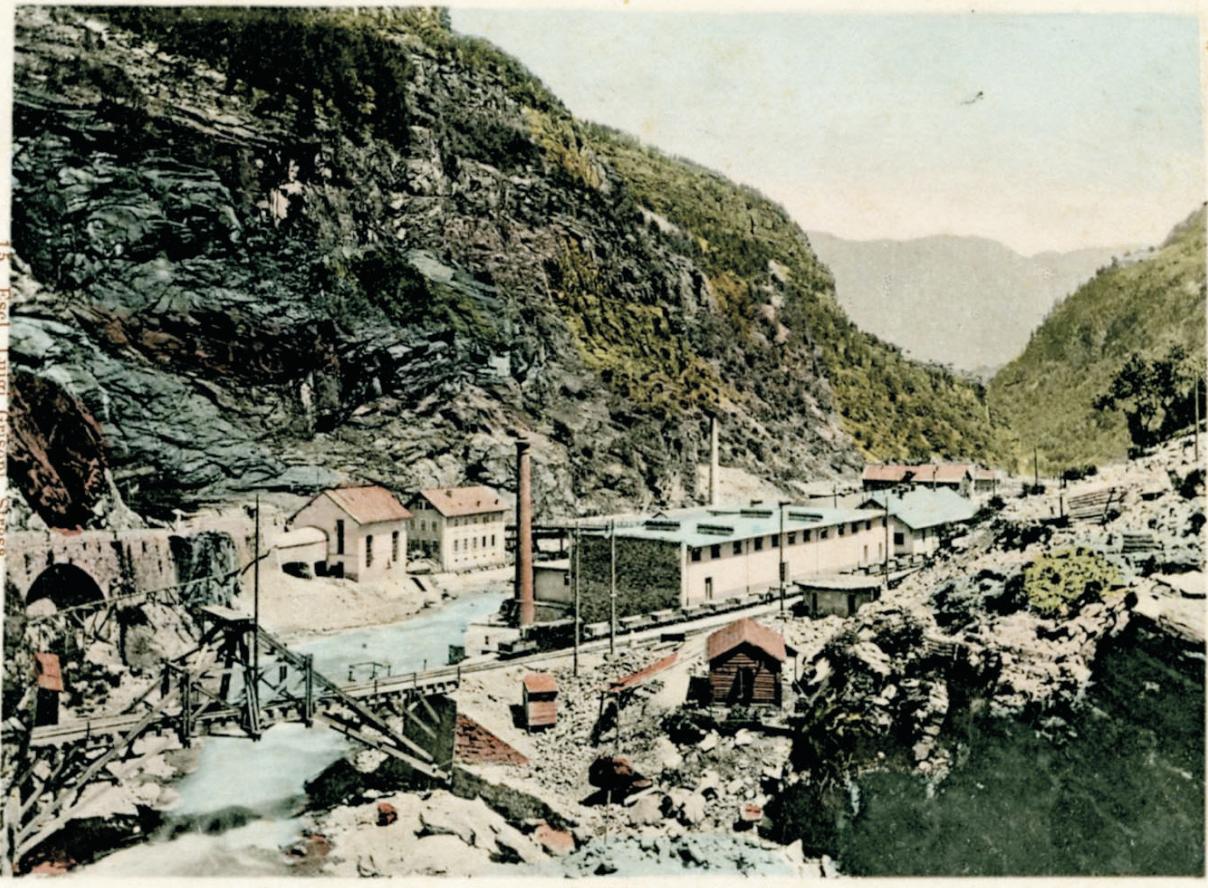
(Strada del Sempione.) Officine pel traforo.