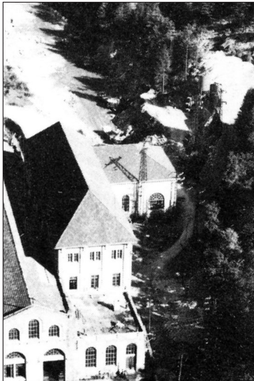
Centrale elettrica di Varzo, Valle Divedro (VB) - 1913